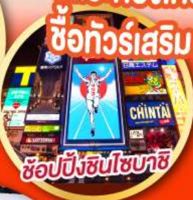
ช้อปปิ้งชินโซบาชิ

อิสระท่องเที่ยว 1 วันเต็มหรือ ช้อทัวร์เสริม UNIVERSAL STUDIOS JAPAN