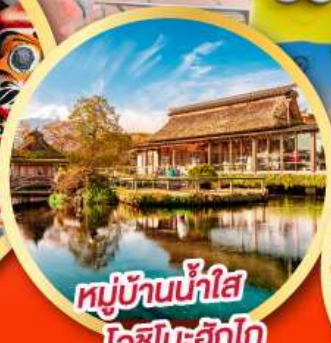
หมู่บ้านน้ำใส โอชิโนะอัทโก