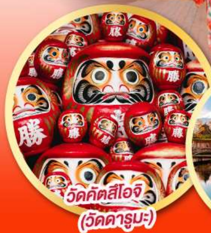
วัดคัตสึโอจิ (วัดดารุมะ)