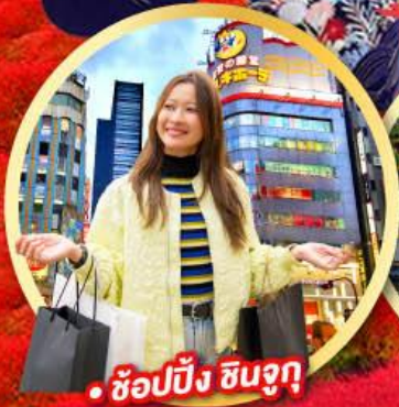
• ช้อปปิ้ง ชินจูกุ

กิจกรรมใส่ชุดกิโมโน พร้อมชมโชว์การแสดงต่างๆ