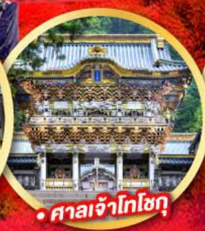
• ศาลเจ้าโทโฮกุ