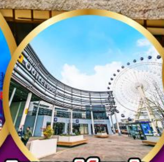
มิตซูเอากะลีตพาร์ค เซนได