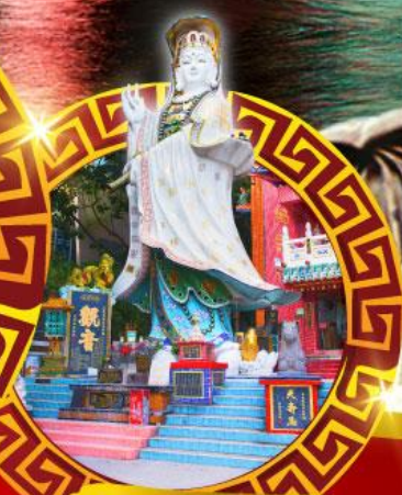
เจ้าแม่กวนอิม หาดริฟส์เบย์