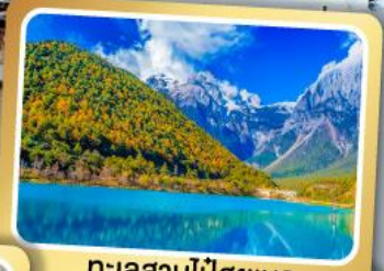
ทะเลสาบปู้ซุยเหอ