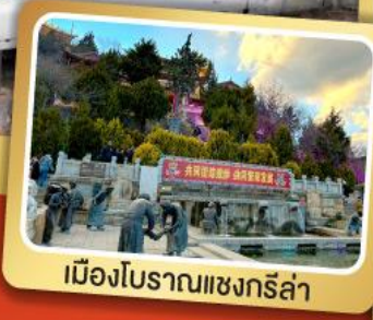
เมืองโบราณแชงกรีล่า