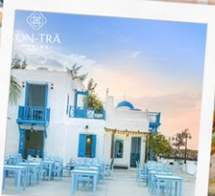
ซานทริน่าคาเฟ่