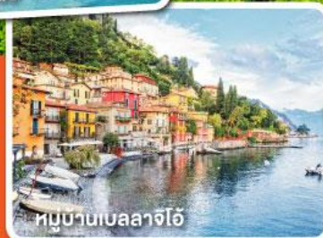
หมู่บ้านเบลลาจีโอ