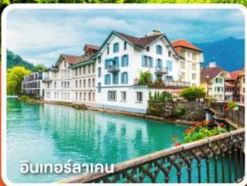
อินเทอร์ลาคูน