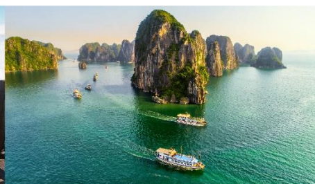
ล่องเรือชมอ่าวฮาลอง

*ทางบริษัทฯ ขอสงวนสิทธิ์ในการสลับโปรแกรมทัวร์ตามความเหมาะสมขึ้นอยู่กับสถานการณ์หน้างาน โดยคำนึงถึงผลประโยชน์ของลูกค้าเป็นสำคัญ