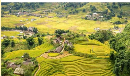
หมู่บ้านต้าฟาน