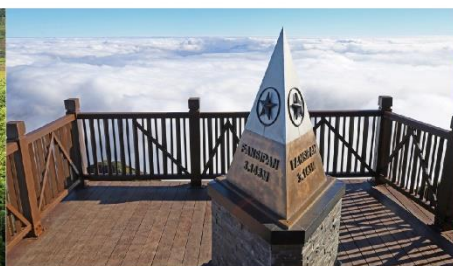
ยอดเขาฟานซิปิน