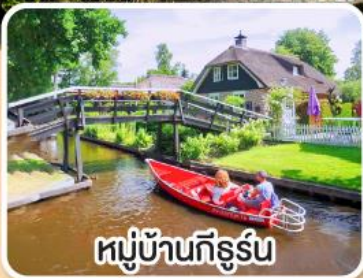
หมู่บ้านกังสุรินทร์