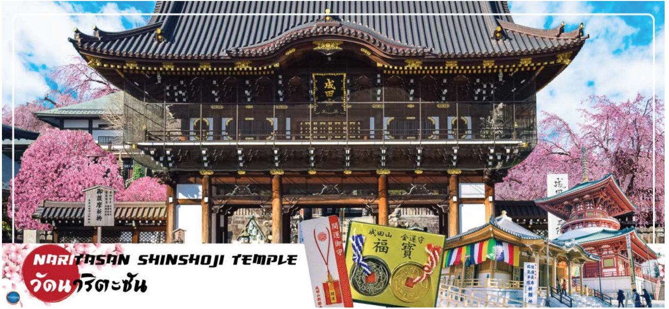
NARITASAN SHINSHOJI TEMPLE วัดนาริตะชิน

วันที่สาม เมืองนาริตะ – วัดนาริตะชิน – ถนนปลาไหล โอโมเตะซังโตะ – จังหวัดไซตามะ – ย่านเมืองเก่าคาวาโกเอะ – ศาลเจ้าฮิคาวะ – จังหวัดยามานาชิ – ออนเซ็น + ชาบูยักษ์