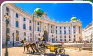
ฮอเฟิลเบิร์กเวียนนา

ตามรอยซีรีส์ Crash Landing on you ที่ทะเลสาบเบรียนซ์