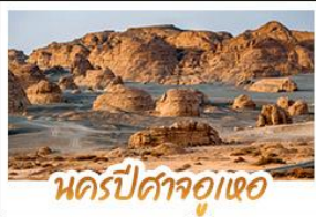
นครปีศาจจิ้งห่อ