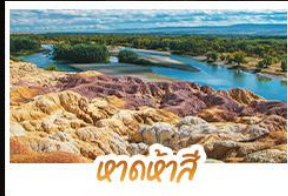
เขาดงเคี