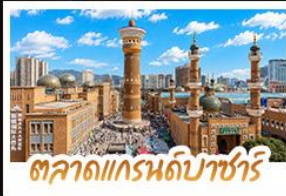
ตลาดแกรนด์บาชาร์