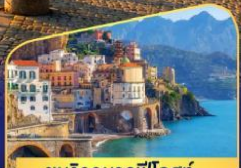
ชมวิวมาลฟีโคสก์