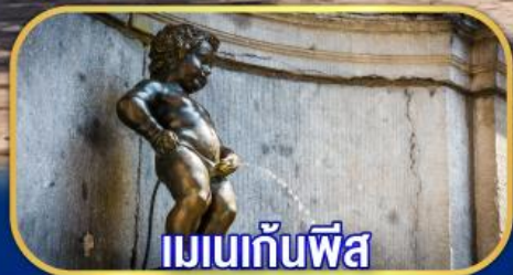
เมเนกันพีส