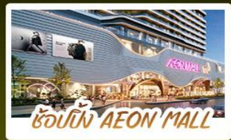
ช้อปปิ้ง AEON MALL