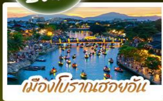
เมืองโบราณเฮอจอัน