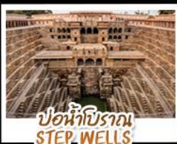
บ่อน้ำโบราณ STEP WELLS

เยือน Taj Mahal 1 ใน 7 สิ่งมหัศจรรย์ของโลก บ่อน้ำโบราณ Step wells - ประตูนกยูง City Palace ตลาดช้อปปิ้ง Janpath - พระราชสาลอม Hawa Mahal