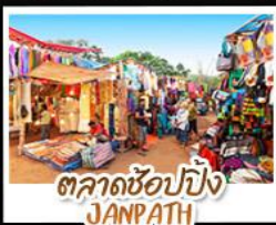
ตลาดช้อปปิ้ง JANPATH