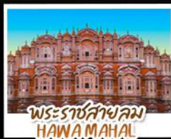
พระราชสาลอม HAWA MAHAL