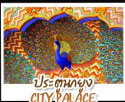
ประตูนกยูง CITY PALACE