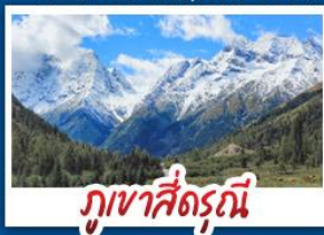
กุเวาสี่ดรุณี

จิวจ้ายโกว - กุเวาสี่ดรุณี - ปี้ผิงโกว สวนดอกไม้บ้านฮวา - ถนนไก่อู๋หู่ - ถนนคนเดินซุนซู่ ถนนโบราณชอยกว้างชอยแคบ - เมฆพิเศษ!!! สุกี่หม่าล่าเสฉวน