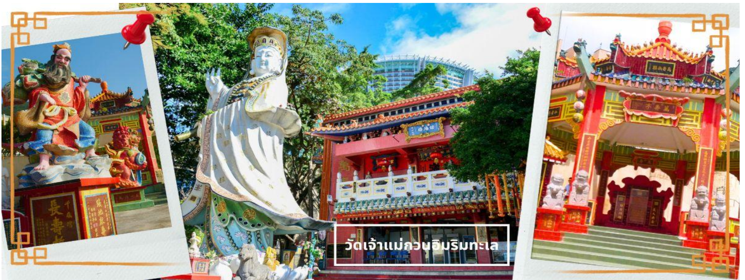
วัดเจ้าแม่กวนอิมบริษัทยูนิคอน

ความศักดิ์สิทธิ์ และยังมีเจ้าแม่ทับทิม หรือเทพธิดาแห่งท้องทะเลองค์ใหญ่ ซึ่งคนฮ่องกง คนมาเก๊า และคนจีน ที่อยู่ริมทะเล ชาวประมง นักเดินเรือหรือผู้ที่เดินทางทางเรือเป็นประจำ จะนับถือเจ้าแม่ทับทิมเป็นอย่างมาก มีความเชื่อว่าเจ้าแม่ทับทิมจะปกป้องเราจากภัยอันตรายระหว่างการเดินทาง ภายในวัดยังมีเทพเจ้าและพระพุทธรูปต่างๆ ประดิษฐานไว้มากมายตามความเชื่อถือศรัทธา เช่น เทพเจ้าไฉ่ซิงเอี้ย ไหว้ขอโชคลาภความมั่งคั่ง ความร่ำรวย, พระสังกัจจายน์ โพธิสัตว์ เทพประทาน บุตร-ธิดา ไหว้อธิษฐานขอลูก, สะพานต่ออายุ (สะพานอายุยืน) สะพานสีแดงตั้งอยู่บนริมหาด สีแดงสด เชื่อกันว่า คนจีนเชื่อกันว่าหากเดินข้ามสะพานนี้ เราจะมีอายุยืนขึ้นอีก 3 วัน (3 วัน บนสวรรค์ = 3 ปี บนโลกมนุษย์) นั่นหมายความว่า ถ้าเราเดินข้ามสะพานนี้แล้ว จะมีอายุยืนยาวขึ้นอีก 3 ปี บนโลกมนุษย์, เทพเจ้าแห่งความรัก ไหว้ขอเนื้อคู่, ศาลา 8 เหลี่ยม เชื่อกันว่าเป็นจุดที่มีดวงจืดที่สุด ภายในศาลาแปดเหลี่ยม จุดกึ่งกลางของพื้น จะมีรูปแปดเหลี่ยม ให้เราไปยื่นขอพรจากตำแหน่งนี้เพื่อขอพลังจากสวรรค์ และอีกมากมาย