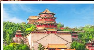
พระราชวังฤดูร้อนอ้อเหอหยวน