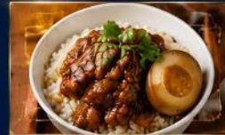
ข้าวหน้าหมูพะโล้ หมูนุ่มละมุน เคี้ยวจนหอมหวาน กลมกล่อม