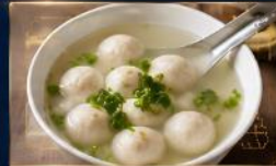
ลูกชิ้นปลา เนื้อแน่น สดใหม่ น้ำซุปหอมอร่อย