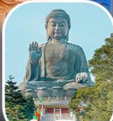
พระใหญ่ไผ่พลิน