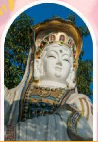
ริพัสเบย์ รับพลังงานดี เสริมพลังดวงจัญ