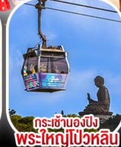
กระเช้าเองปิง พระใหญ่ไผ่หลิน