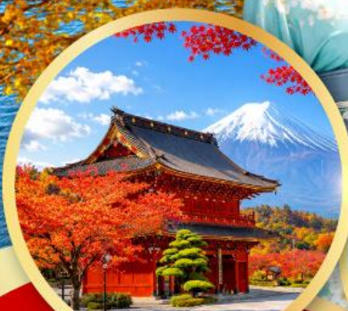
ชมประตูโทเซกิกิจิแซนมอน วัดโทเซกิกิจิ