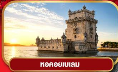
หอคอยเบเลม