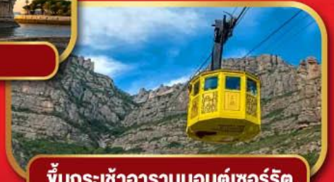
ขึ้นกระเช้าอารามมอนต์เซอร์ริต