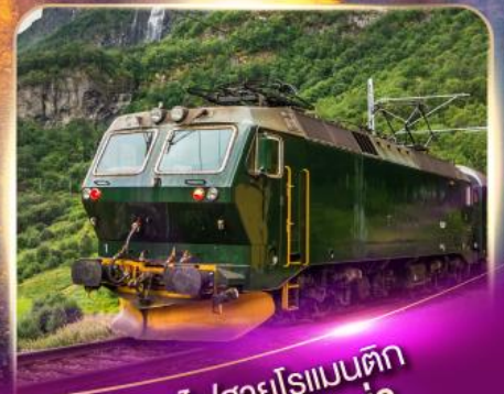
รถไฟสายโรแมนติก ฟลัมส์บาน่า