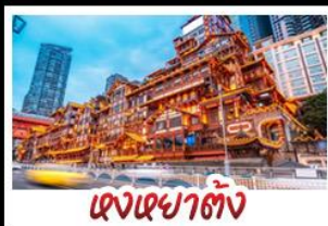
เฉิงเฉิงเฉิง

อุทยานหลุมบ่อฟ้า - อุทยานเทานางฟ้า หงหยาดัง - นังรถไฟทะลุคอก - อุทยานสี่ดรุณี ปี้เฉิงโกว - สะพานหนานเฉียว