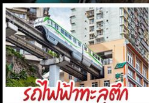
รถไฟฟ้าทะลุคอก