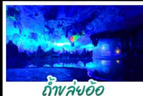
ถ้ำคู้อ้อ

เขาคู้อี+สะพานแดง - ล่องเรือแม่น้ำห่อหุ้มเจียง น้ำขึ้นบันไดสีทองอร่าม - กำลุ่มอ้อ - ภูเขาหวงชาง เจดีย์เงินเจดีย์ทอง - รถไฟความเร็วสูง เมฆพิเศษ บูฟไฟต์ย่างบาร์บิวัว ปลาอบเบียร์ เขื่อนคริสตัล สุกี้หัด