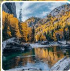
เคอเคอทัวไห่