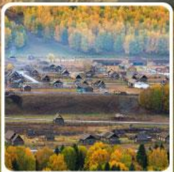
หมู่บ้านเหม่มู

สวรรค์ใบไม้เปลี่ยนสี เขื่อนคานาสีอแดนฟัน มหัศจรรย์หมู่บ้านเหม่มู เคอเคอทัวให้อัจฉรัยภูผาหิน