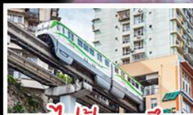
รถไฟฟ้าทะเลตัก