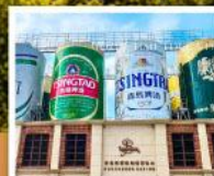
พิลส์กันที่เบียร์ชิงเต่า