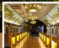
พิลส์กันที่ไวน์ชิงเต่า