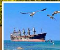
เรือสินค้าเกย์ตันบลูอิส