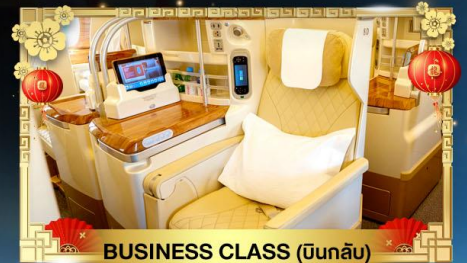
BUSINESS CLASS (บินกลับ)

น้ำหนักกระเป๋า ขาไป 30Kg. | จากกลับ 40Kg.