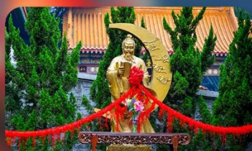
วัดหวังค้ำเซียน