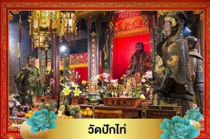
วัดบิกโท