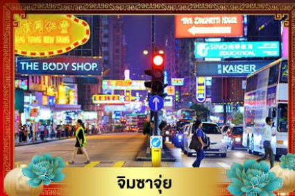
จิมซาจ๋วย