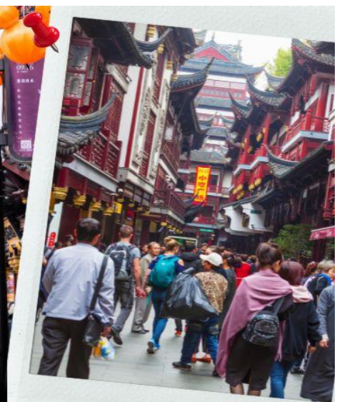
📍 ตลาดเจิ้งหวังเมี่ยว

สมควรแก่เวลา เดินทางสู่สนามบินนานาชาติ ผู้ตงเซี่ยงไฮ้ เพื่อกลับกรุงเทพฯ