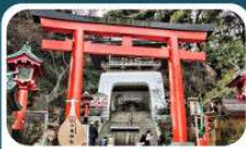
ศาลเจ้าอิโนะชิมะ