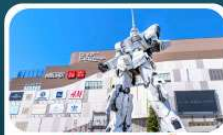
ห้างโตเวอร์ซิตี