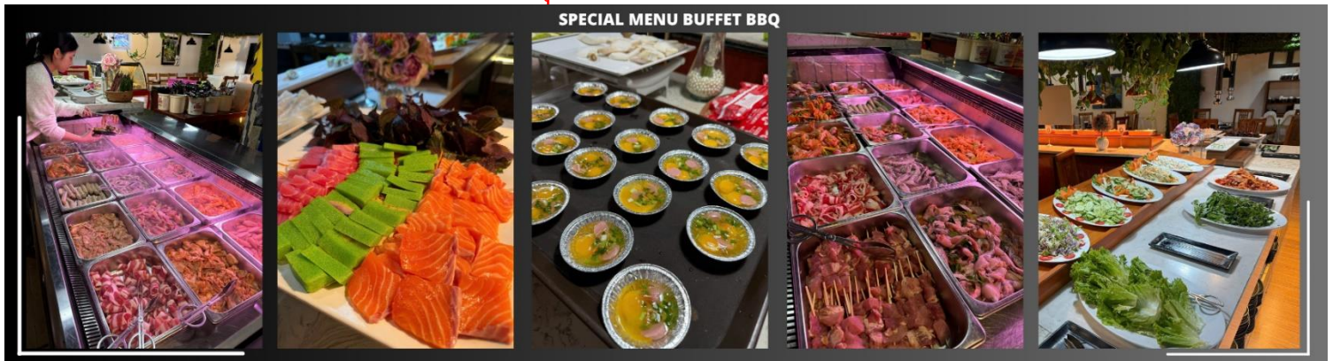
SPECIAL MENU BUFFET BBQ

ค่ำ รับประทานอาหารค่ำ ณ ภัตตาคาร บุฟเฟต์ BBQ (3)