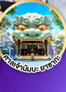
ศาลเจ้ามิมะ ยาชากะ