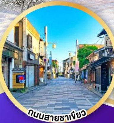
ถนนสายชาเขียว