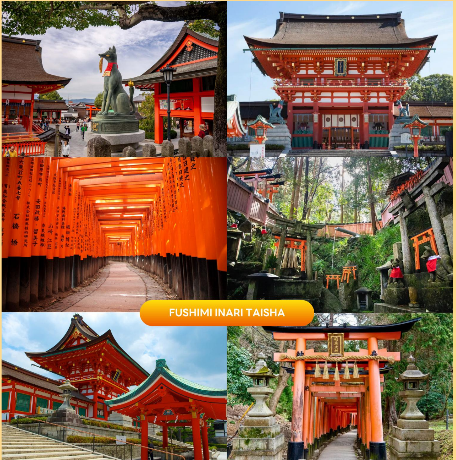
FUSHIMI INARI TAISHA

นำท่านสู่ ศาลเจ้าฟูชิมิอินาริ (Fushimi Inari Taisha) สร้างขึ้นเพื่ออุทิศแก่ อินาริ เทพเจ้าแห่งการเพาะปลูก และการค้า ที่รุ่งเรือง เป็นศาลเจ้าที่สำคัญที่สุดในบรรดาศาลเจ้าอินาริทั้งหมดในญี่ปุ่น แนวเสาประตูโทริอิสีส้มสดใสทอดยาวอย่างสุดตา ที่ทอดยาวขึ้นไปสู่ยอดเขาอินาริ ทำให้เกิดเป็นภาพอันน่าประทับใจ และเป็นหนึ่งในภาพที่โด่งดังของญี่ปุ่น ฟูชิมิอินาริโทยะนั้นเป็นทั้งศาลเจ้าของประชาชน และของราชสำนัก เป็นศาลที่พระจักรพรรดิหลายพระองค์มักแวะเวียนมาสักการะตั้งแต่ในอดีต ( การเปลี่ยนสีของใบไม้ ขึ้นอยู่กับสภาพอากาศเป็นสำคัญ )