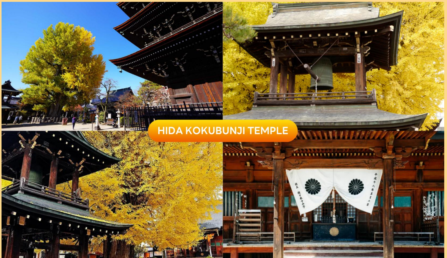
HIDA KOKUBUNJI TEMPLE

จากนั้นนำท่านชม วัดฮิดะโคคุบุบุนจิ (Hida Kokubunji Temple) เป็นวัดพุทธที่เป็นเหมือนสัญลักษณ์ของเมืองทาดายาม่า เจดีย์สามชั้นองค์นี้สร้างขึ้นในปี 1820 ภายในอุโบสถมีพระพุทธรูปที่สร้างขึ้นในยุคเฮอันให้สักการะ ภายในบริเวณวัดมีต้นแปะก๊วยขนาดใหญ่ที่ว่ากันว่าแก่มันมีอายุถึง 1,250 ปี ที่ใครมาทาดายาม่าก็ต้องไปชมเลยทีเดีย (ราคาทัวร์รวมค่าเช้า) (การเปลี่ยนสีของใบไม้ ขึ้นอยู่กับสภาพอากาศเป็นสำคัญ)