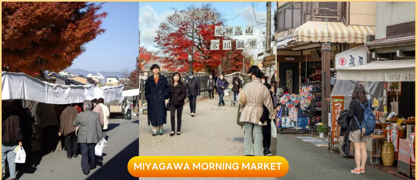
MIYAGAWA MORNING MARKET

จากนั้นนำท่านชม วัดฮิดะโคคุบุบุนจิ (Hida Kokubunji Temple) เป็นวัดพุทธที่เป็นเหมือนสัญลักษณ์ของเมืองทาดายาม่า เจดีย์สามชั้นองค์นี้สร้างขึ้นในปี 1820 ภายในอุโบสถมีพระพุทธรูปที่สร้างขึ้นในยุคเฮอันให้สักการะ ภายในบริเวณวัดมีต้นแปะก๊วยขนาดใหญ่ที่ว่ากันว่าแก่มันมีอายุถึง 1,250 ปี ที่ใครมาทาดายาม่าก็ต้องไปชมเลยทีเดีย (ราคาทัวร์รวมค่าเช้า) (การเปลี่ยนสีของใบไม้ ขึ้นอยู่กับสภาพอากาศเป็นสำคัญ)