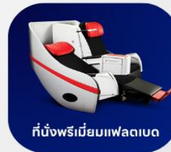
ที่นั่งพรีเมียมฟเลกซ์