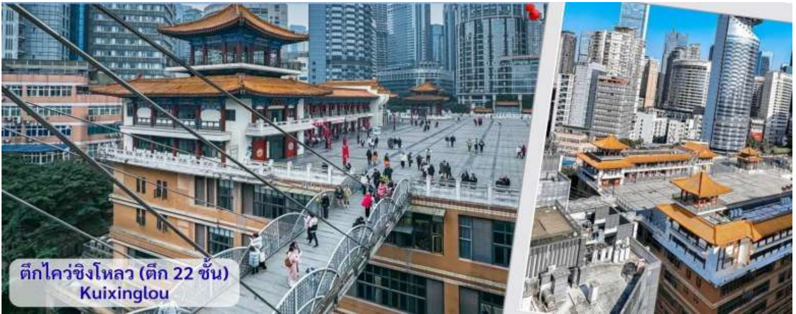
ตึกไควซิงโหลว (ตึก 22 ชั้น) Kuixinglou