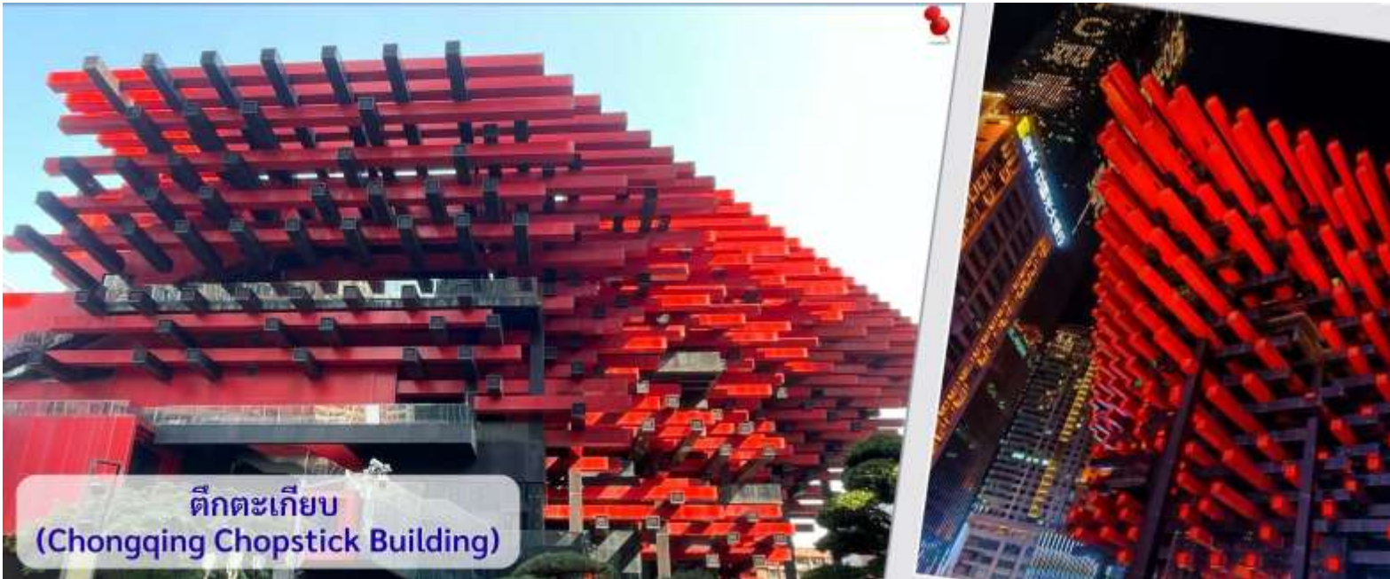
ตึกตะเกียบ (Chongqing Chopstick Building)

จากนั้นอิสระถ่ายรูปหน้า ตึกตะเกียบ ฉงชิ่ง(ด้านนอก) คือ ฉงชิ่งกั๋วไถอาร์ทเซ็นเตอร์ (Chongqing Guotai Arts Center) เป็นแลนด์มาร์กสำคัญที่มีสถาปัตยกรรมคล้ายตะเกียบยักษ์สีแดงและดำวางซ้อนกัน เป็นศูนย์จัดแสดงงานศิลปะและสถานที่ท่องเที่ยวที่นิยมสำหรับการถ่ายรูป โดยเฉพาะในเวลาากลางคืนเมื่อเปิดไฟสวยงาม สิ่งก่อสร้างอันมีเอกลักษณ์ อาคารนี้ถูกวางโครงสร้างให้มีรูปร่างคล้ายกอง "ตะเกียบยักษ์" สีดำและแดงที่วางซ้อนกันเป็นชั้นๆ ที่ส่วนปลายของตะเกียบสีแดงจะมีตัวอักษรจีนคำว่า "กั๋ว" ประทับอยู่ ซึ่งมีความหมายถึง ชาติหรือประเทศ ส่วนที่ปลายตะเกียบสีดำ จะมีอักษรจีนคำว่า "ไถ" ประทับอยู่ ซึ่งหมายถึง ความเจียบสงบ หรือความอุดมสมบูรณ์