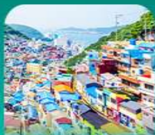
หมู่บ้านดัมชอน