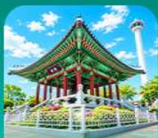
สวนเขงดุซาน