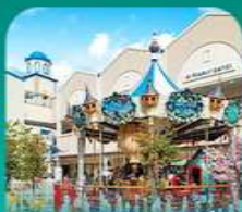
วัดแฮดงจงกุงซา