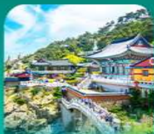
วัดแฮดงจงกุงซา

เที่ยวปูซานแบบแกรนด์ แกรนด์ ทั้งสายอาร์ท สายบู และสายช้อปปิ้ง • เช็กอินแบบถ่ายรูปสุดคลาสเซอร์ฟ ท์ทำเรื่องจิมิน (BUSAN BUWEZIA) เดินเล่นหมู่บ้านคิมชอน ชายเคอร์รี่แห่งปูซานสุดน่ารัก พลาดไม่ได้กับการนั่งรถไฟปูซาน • เสริมสิริมงคลที่วัดแห่งของกุงซา วัดริมทะเลชื่อดัง พร้อมช้อปปิ้งที่ตลาดพัชร์น็อมเจ้าที่เลิศ และตลาดนัมโพคง ก่อนปิดท้ายด้วย ย่านวีอรัมสุดชิค ซอ มยอง ออเนิว พร้อมชมวิวสะพาน ควังอินยามค่าสินสุดโรแมนติก