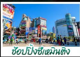
ซ้อปั้งซีเหมินตง