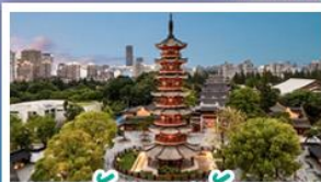
วัดแฉงเซวี่