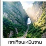
ชาเทียนเหมินซาน