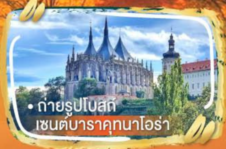
• ถ่ายรูปโบสถ์ เซนต์บาราคุกนาโอร่า