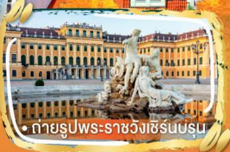
• ถ่ายรูปพระราชวังเซิร์นบรุน