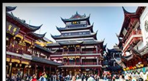
ตลาดร้อยปีฉงหวงเมี้ยว