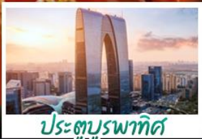
ประตูบูรพาทิศ