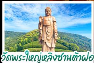
วัดพระใหญ่เฉิงชานต้าฝอ