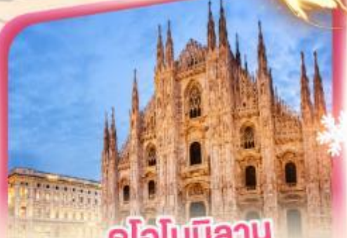
คูโอโมมิลาโน