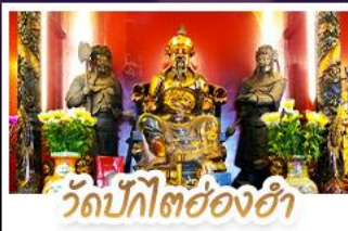
วัดปักไต่ซ่งฮ่า

นั่งกระเช้าแองปิงสักการะพระใหญ่เทียนถาน • ขอบรองคัมเข่ง โชคลาภ การเงินและธุรกิจ เทพเจ้าปักไต่ซ่งฮ่า ขอพรเรื่องความสำเร็จในชีวิตและภาระงาน • วัดหวังต้าเซียน สักการะสิ่งศักดิ์สิทธิ์ เสริมมงคลชีวิต • เข้าเม่กวนอิมย่องฮ่า ขอเรื่องเงิน ทรัพย์สิน และความมั่งคั่ง • อิศระท่องเที่ยว 2 วัน เลือกซื้อบัตรดิสนีย์แลนด์หรือช้อปปิ้งจุใจ