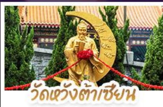
วัดเข่งต้าเซียง