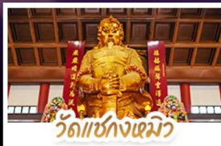
วัดเซ่งก่งเมี้ยว