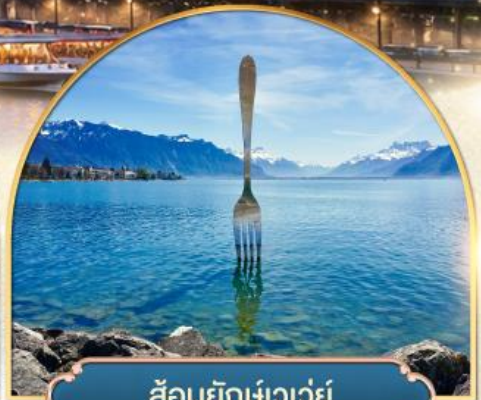
ส้อมยักเข่าเว่ย