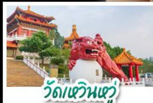
วัดเขินเฮวี่