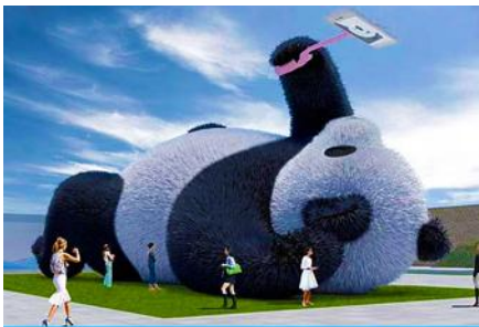
ตุ๊กตาแพนด้าบนเซลฟี

หลังอาหารนำท่านเดินทางสู่ เมืองตูเจียงเยียน 都江堰 (ระยะทาง 234 กม. ใช้เวลาเดินทางราว 4 ชั่วโมง) ระหว่างเดินทางท่านสามารถชมทัศนียภาพธรรมชาติอันงดงามของสองข้างถนนขณะที่รถแล่นผ่าน ที่มีทั้งภูเขาหิมะสูง หุบเขา ธารน้ำ และทุ่งหญ้าบนที่ราบสูง หรือพักผ่อนตามอัธยาศัยบนรถระหว่างเดินทาง