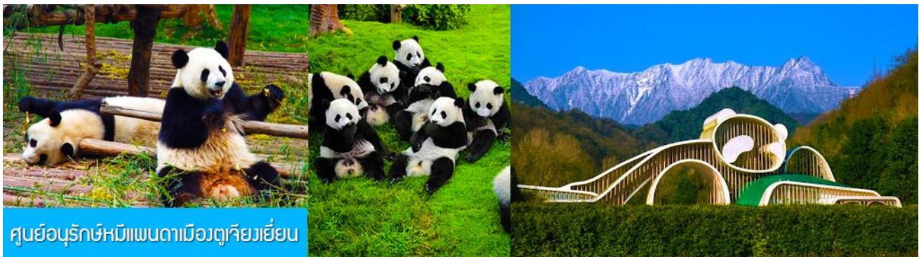
ศูนย์อนุรักษ์หมีแพนดามืองตู่เจียงเยียน