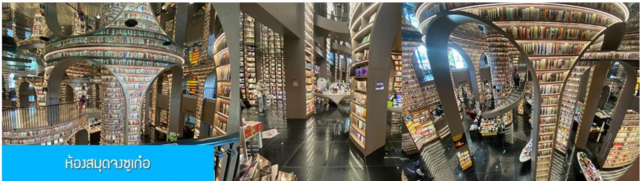
ห้องสมุดจงซูเก้อ

พักที่ โรงแรม MINGZHISHANGCHUN HOTEL ระดับ 4 ดาวท้องถิ่นหรือเทียบเท่าในเมืองตู่เจียงเยียน